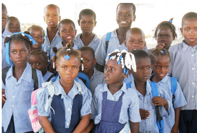
Sortie des classes à Grand Islet

Il faut aussi compter le matériel scolaire, les livres, les uniformes (souvent obligatoires) ... Au cours de l'année, peuvent s'ajouter d'autres dépenses :